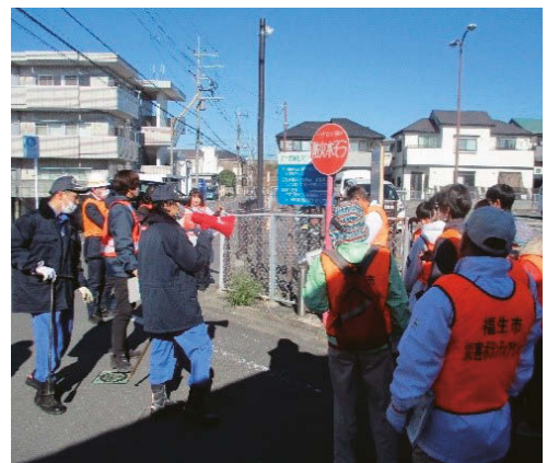
防災まち歩きで消防水利もしっかり把握