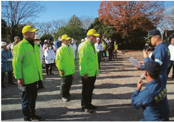
長年の努力を称える感謝状の贈呈

南田園地区には四つの町会・自治会・南田園一、二、三丁目、福生団地があります。ハザードマップに示されているとおり市内で最も水に弱い地域であり、町会・自治会活動では長年にわたり諸先輩たちが自主防災活動の中で大雨、台風時の多摩川増水・洪水を意識して取り組んできました。