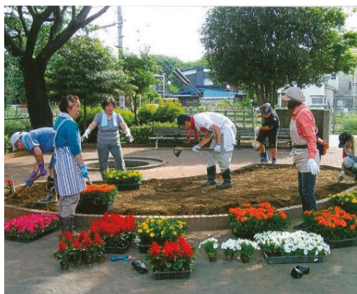
植栽は皆で取り組む地域のデザイン