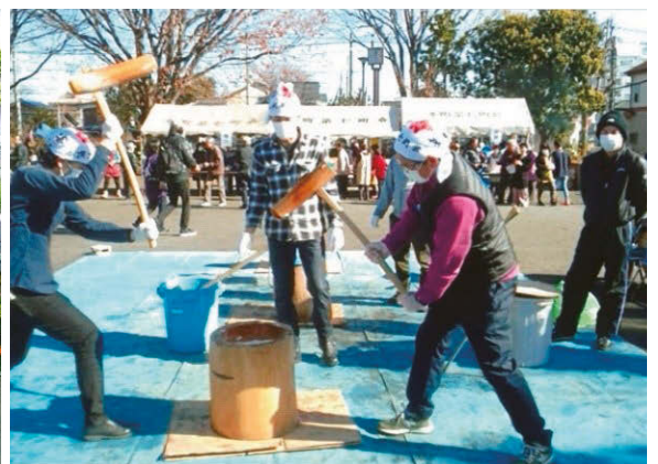
年の始めは、元気よくお餅つき