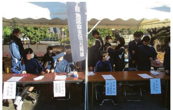
将来が楽しみな中学生たちの参加

毎年実施の地域防災訓練・四地区合同水・防災訓練は令和5年12月に行った開催で26回となりました。お陰様でこの長年にわたる活動が評価され訓練時に東京消防庁防災部長より感謝状をいただきました。